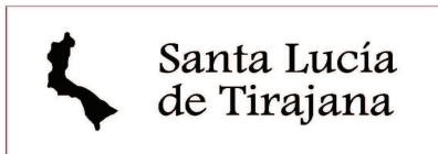
Anagrama de silueta del T.M de Santa Lucía ( estilo de texto Andalus )